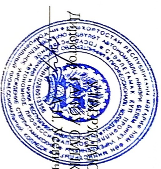
График промежуточной аттестации группы Д-215 специальности 54.02.01 Дизайн(по отраслям)